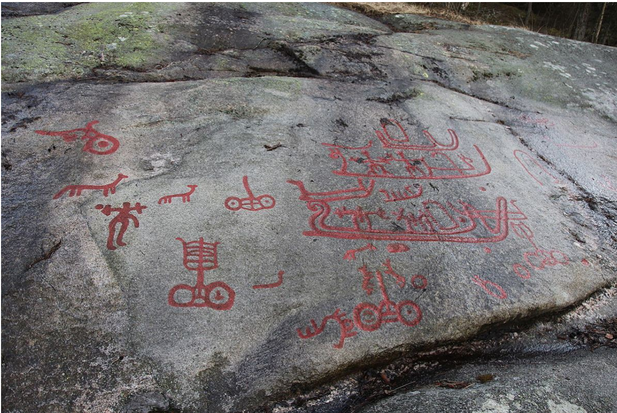
Jordbruksristninger fra Begby utenfor Fredrikstad i Østfold.